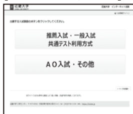
①「AO入試・その他」を選択する。