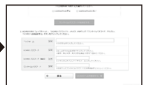
④同画面でワンタイムパスワードと他の必要事項を入力し、「UCAROへ会員登録する」をクリックする。それ以降は③出願の手続きに従って出願する。