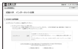
③メールアドレスを入力し、「ワンタイムパスワードを送信する」をクリックする。入力したアドレスにワンタイムパスワードが記載されたメールが届く。