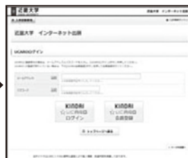
②「UCARO会員登録」を選択する。