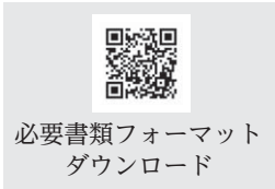
必要書類フォーマット ダウンロード

※入試情報サイト ( https://kindai.jp/exam/apply/documents/ ) からダウンロードしたものを使用することも可能です。